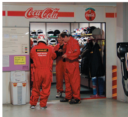
...dann gehts zum Umkleideraum und hinein in schon fast professionelle Rennmonturen.